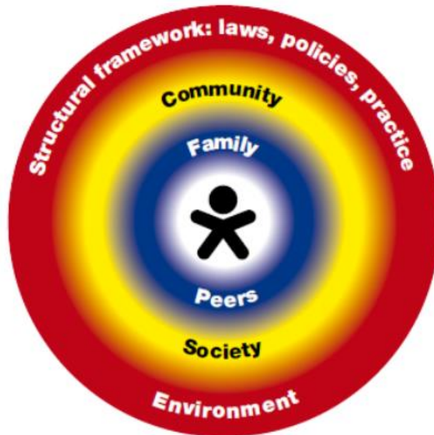
Figure 2: Risk and resilience influence the child's vulnerability and interact at different levels